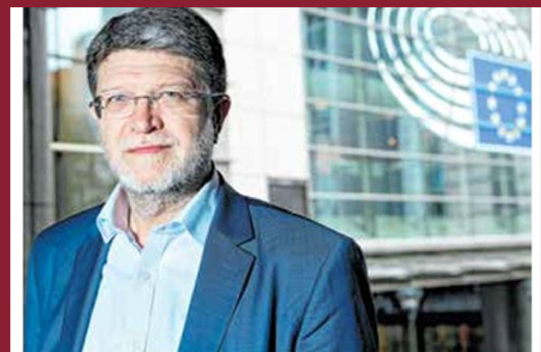
Tonino Picula od Europske komisije traži donošenje mjera za zaštitu proizvodnje i zaposlenih u vinarskom sektoru

Hrvatski zastupnik u Europskom parlamentu Tonino Picula uputio je 29. travnja Europskoj komisiji pitanje o planiranim mjerama za zaštitu proizvodnje i zaposlenih u vinarskom sektoru, koji u Europskoj uniji zapošljava preko dvjesto tisuća ljudi. Naime, Picula ocjenjuje kako se vinska industrija zbog negativnog utjecaja krize pandemije našla pod snažnim pritiskom te zahtijeva podršku. Zbog zatvaranja glavnih kanala prodaje, poput restorana, hotela i drugih ugostiteljskih objekata, te općenito prestanka turističkih aktivnosti, naša domaća, hrvatska vinska industrija trpi snažne gubitke prodaje i izvoza vina od početka izbijanja krize. „Nažalost, kriza za sektor nije kratkoročna, te neće prestati popuštanjem restrikcija, jer se očekuje i daljnji pad prihoda zbog mjera tzv. socijalnog distanciranja te nadolazeće ekonomske krize koja će rezultirati smanjenom potrošnjom“, istaknuo je. Piculina konkretna pitanja Komisiji ticala su se planova o ciljanim mjerama podrške vinskoj industriji, snažnom europskom industrijskom sektoru koji izravno zapo-